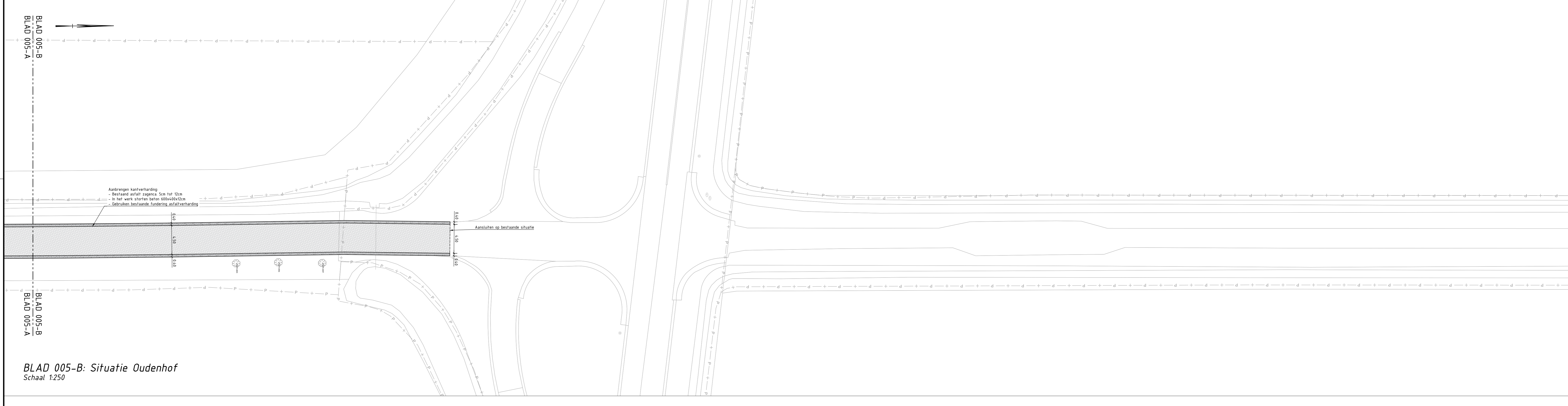
BLAD 005-B: Situatie Oudenhof Schaal 1:250