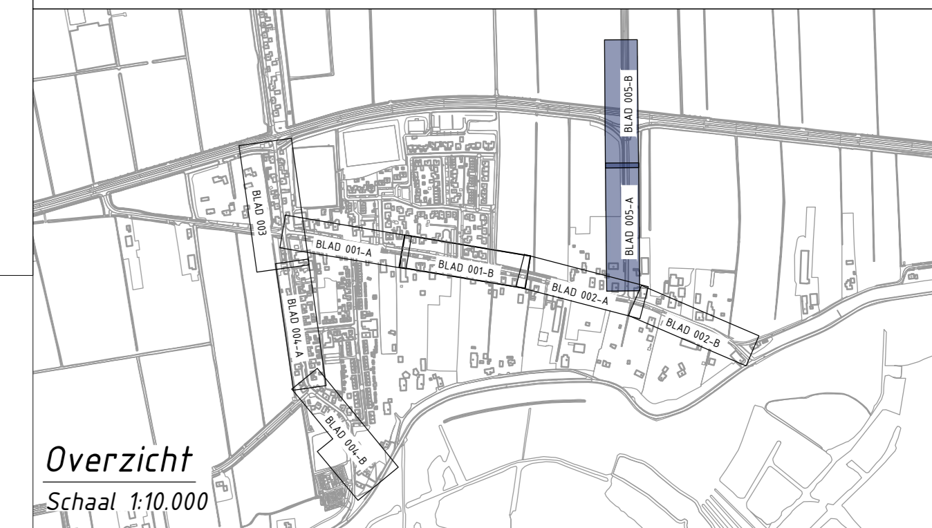
Overzicht Schaal 1:10,000

Opmerkingen: • Maten in meters; • Dimensies van materialen in millimeters; • Hoogtematen in meters t.o.v. NAP