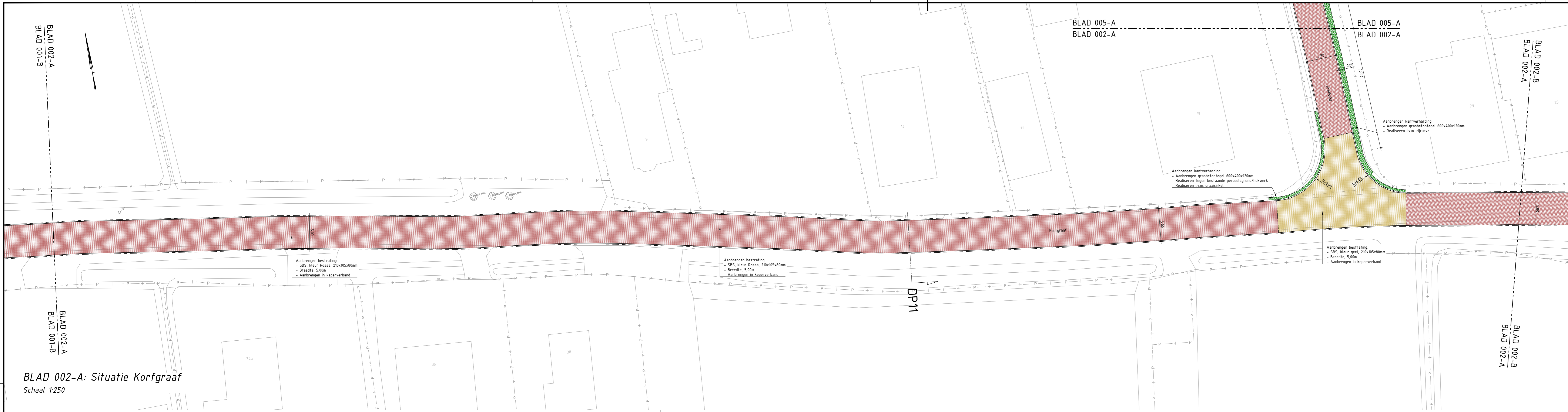
BLAD 002-A: Situatie Korfgraaf Schaal 1:250