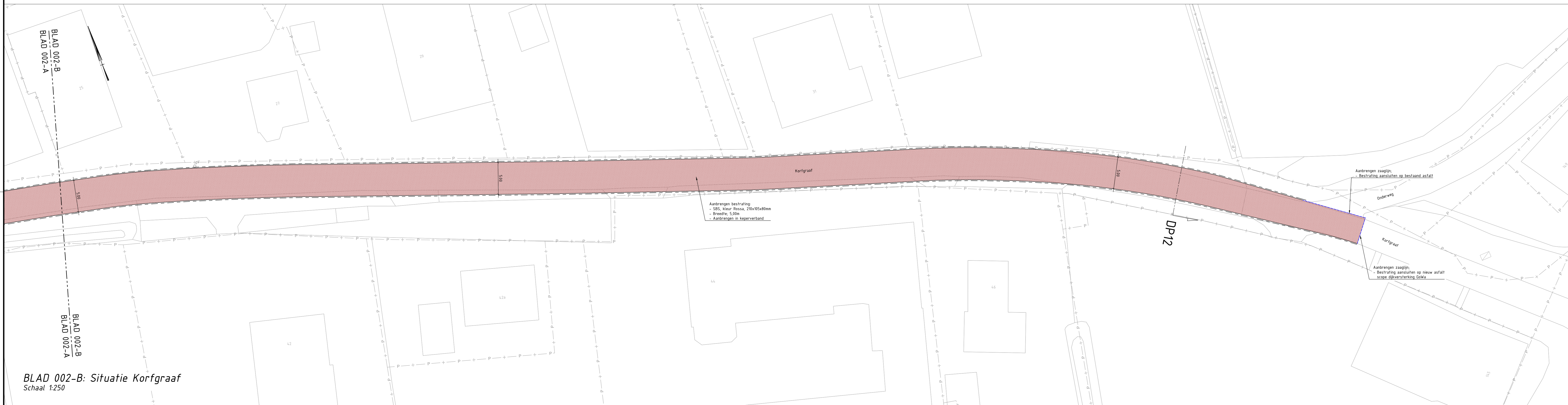
BLAD 002-B: Situatie Korfgraaf Schaal 1:250